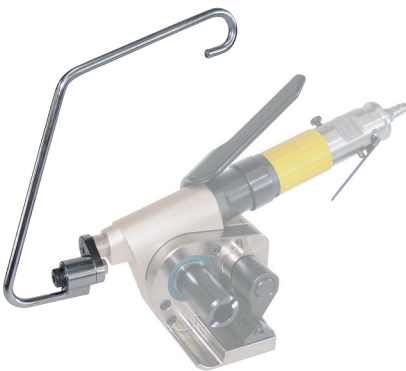
Aufhängebügel Hanger bow